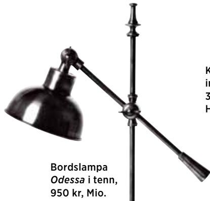
Bordslampa Odessa i tenn, 950 kr, Mio.