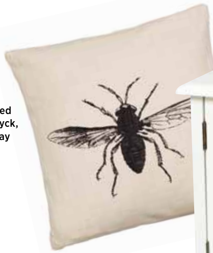
Kudde med insektstryck, 359 kr, Day Home.