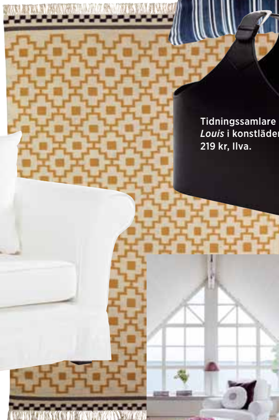
Ullmatta Alvine ruta 240x170 cm, 1 595 kr, Ikea.

Vackra rum med klassiska möbler och personliga detaljer.