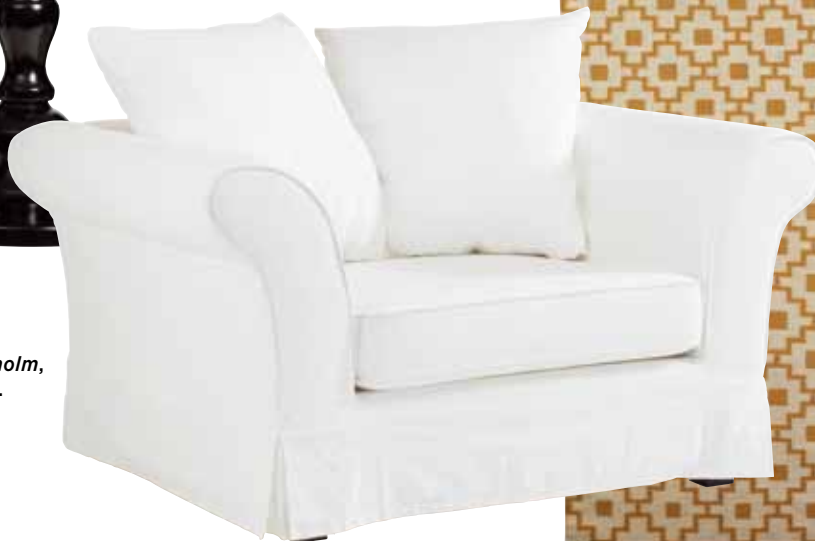
Fätölj Stockholm, 4 995 kr, EM.