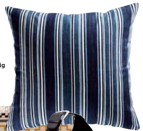
Blårandig kudde, 179 kr, Åhléns.