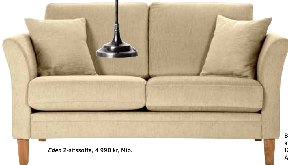
Eden 2-sitssoffa, 4 990 kr, Mio.