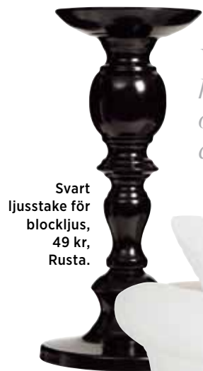
Svart ljusstake för blockljus, 49 kr, Rusta.

Vackra rum med klassiska möbler och personliga detaljer.