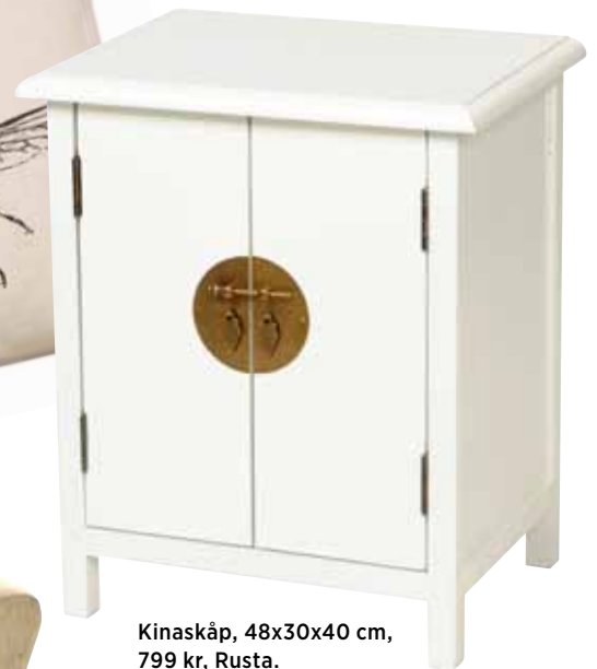
Kinaskåp, 48x30x40 cm, 799 kr, Rusta.