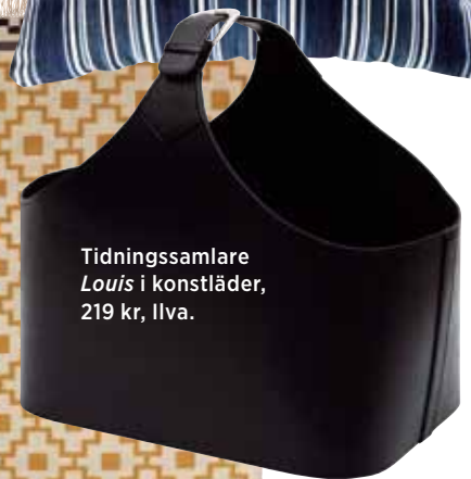
Tidningssamlare Louis i konstläder, 219 kr, Ilva.