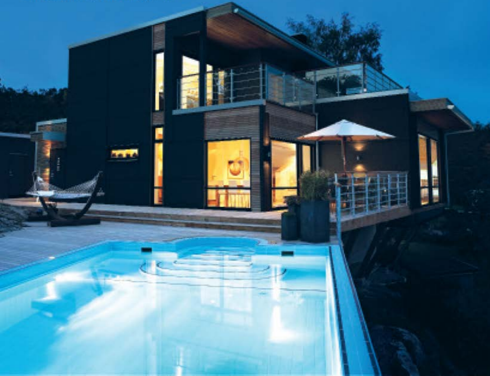
Förslag på planlösning från arkitekt Nils Nordkvist till Hus med Attityd 192.

Bilden är redigerad för att visa hur huset skulle se ut med svarta fasadskivor och några andra mindre justeringar.