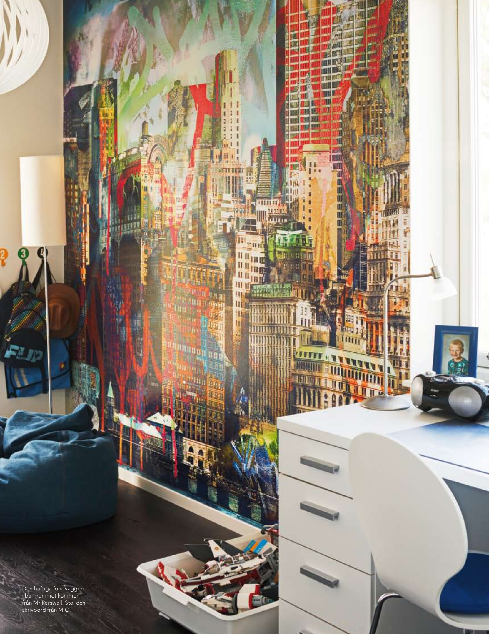
Den häftiga fondväggen i barnrummet kommer från Mr Perswall. Stol och skrivbord från MIO.