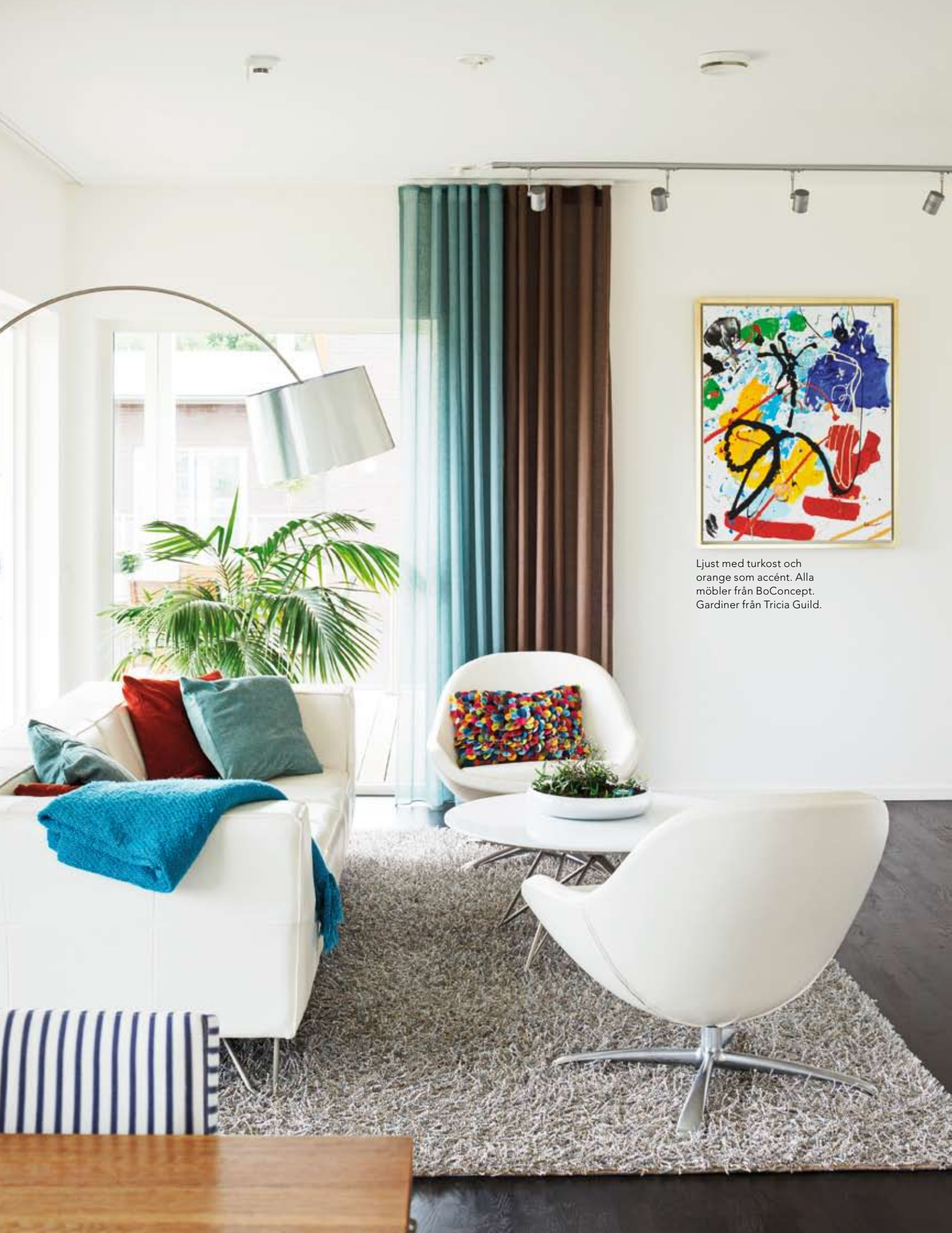
Ljust med turkost och orange som accént. Alla möbler från BoConcept. Gardiner från Tricia Guild.