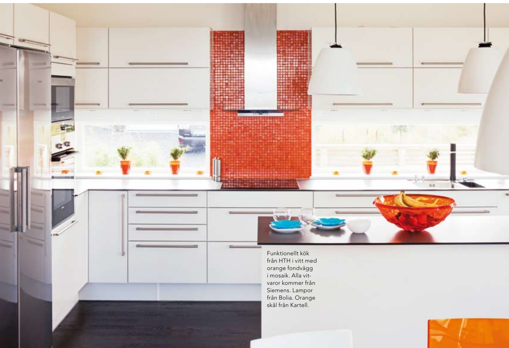
Funktionellt kök från HTH i vitt med orange fondvägg i mosaik. Alla vitvaror kommer från Siemens. Lampor från Bolia. Orange skål från Kartell.

"...vi får väldigt mycket rymd och luft i rummen."