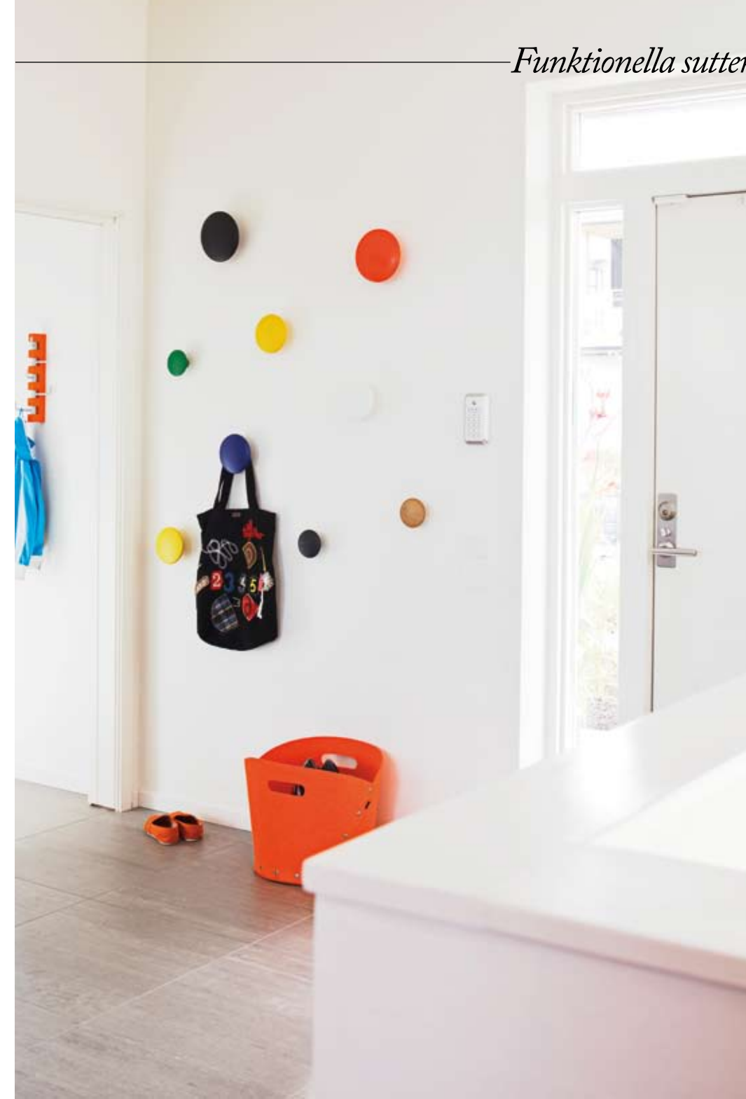
De färgglada knapparna i hallen kommer från Muuto, där en har målats för att passa det orangea temat.