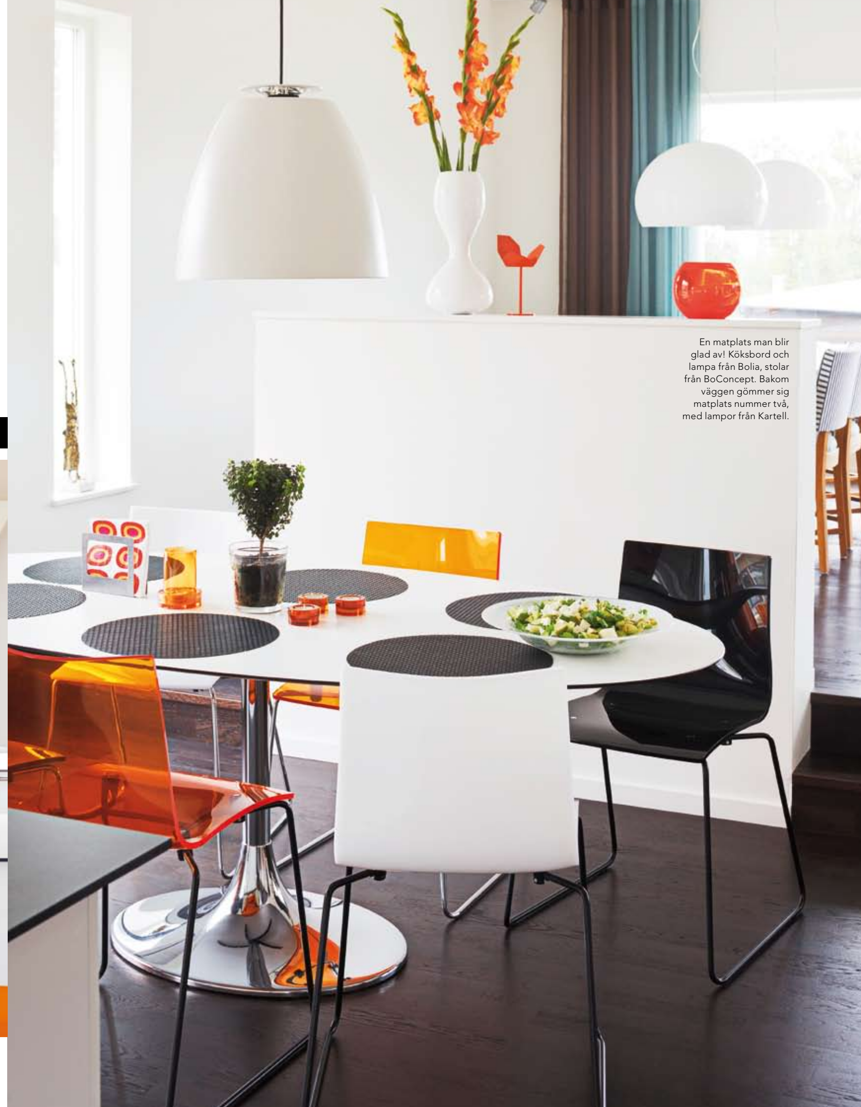
En matplats man blir glad av! Köksbord och lampa från Bolia, stolar från BoConcept. Bakom väggen gömmer sig matplats nummer två, med lampor från Kartell.